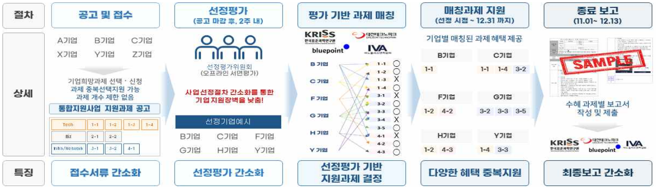
그림 1. 2026 통합지원사업 추진절차 및 추진방법